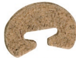
Attache bois standard